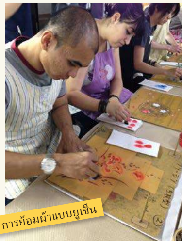
การย้อมผ้าแบบยูเซ็น