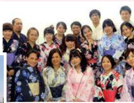
ประสบการณ์ทางวัฒนธรรม (สวมชุดยูกาตะ)