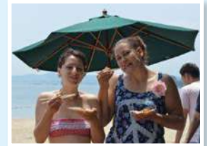
ปาร์ตี้บาร์บีคิว