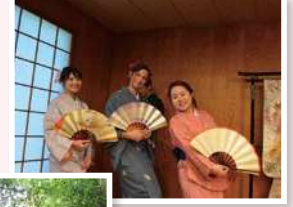
ประสบการณ์ทางวัฒนธรรม (การเดินรำแบบญี่ปุ่น)