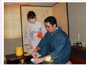
พิธีชงชา