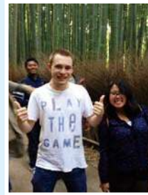
การเดินทางไปอาราชิยามะ