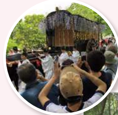
เทศกาลอาโออิ