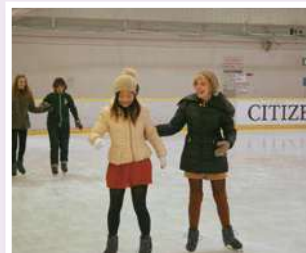
สเก็ตน้ำแข็ง