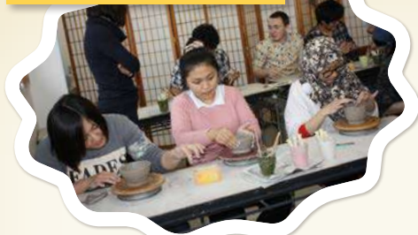
ประสบการณ์ด้านศิลปะเซรามิก

มีสถานที่มากมายให้สัมผัสกับประสบการณ์ทางวัฒนธรรมญี่ปุ่นในทุกภูมิภาคของประเทศญี่ปุ่น นอกจากการเรียนในห้องเรียนแล้ว ยังมีโอกาสที่จะได้มีส่วนร่วมในกิจกรรมการเรียนรู้นอกหลักสูตร และมีปฏิสัมพันธ์กับนักเรียนนอกห้องเรียน นอกจากนี้ยังมีโอกาสที่จะมีปฏิสัมพันธ์กับนักเรียนมัธยมศึกษาตอนปลายและนักศึกษาวิทยาลัยญี่ปุ่น เรามาสังสร้างความทรงจำที่น่าจดจำที่เคแอลเอ (KLA) กันเถอะ