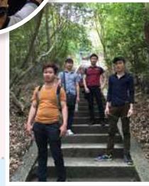
การเดินทางไกลด้วยเท้า