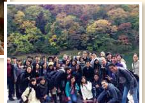
ฤดูใบไม้ร่วง