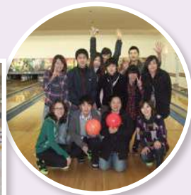
เล่นโบว์ลิ่ง