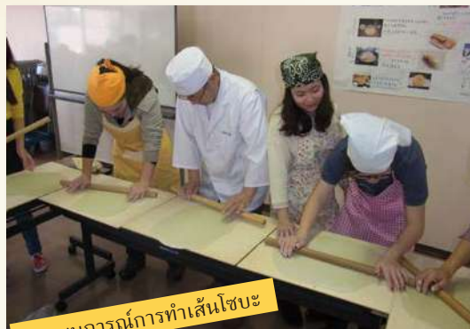
ประสบการณ์การทำเส้นโซบะ