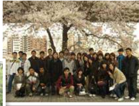
ชมดอกซากุระ