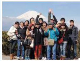
การเดินทางสู่ภูเขาฟูจิ