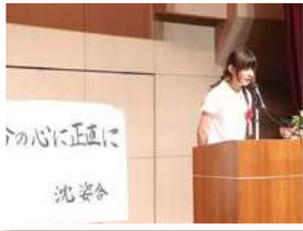
ประกวดสุนทรพจน์ ภาษาญี่ปุ่น