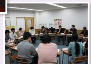
การอภิปรายกับนักศึกษา มหาวิทยาลัยญี่ปุ่น