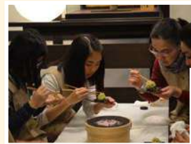
ทำขนมหวานญี่ปุ่น