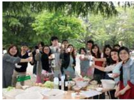
ปาร์ตี้บาร์บีคิว