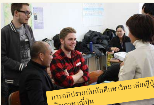
การอภิปรายกับนักศึกษาวิทยาลัยญี่ปุ่นเป็นภาษาญี่ปุ่น